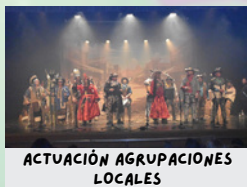
ACTUACIÓN AGRUPACIONES LOCALES