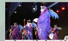
CONCURSO LOCAL DE AGRUPACIONES