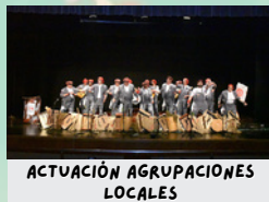
ACTUACIÓN AGRUPACIONES LOCALES